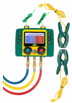
????????? ?????????????? ???? REFCO REFMATE-2+CA-TC 4688126

?????????????: ??? ?????????????? ?????? ?????